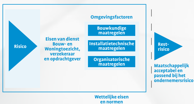
Figuur: wettelijk eisen en normen uit model IBB

belangen van de bewoners/patiënten. Deze hebben recht op een prettige leefomgeving waarin bijvoorbeeld roken en ander risicoverhogend gedrag gewoon gegevens zijn. Bij aanwezigheid van een brandveiligheidsconcept, dient dit als het fundament voor optimale informatievoorziening aan alle betrokkenen tijdens het (ver)bouwproces én tijdens het gebruik. Hiermee ontstaat samenhang en kunnen de betrokkenen, met hun specifieke kennis van de brandveiligheidsonderdelen, zorgen voor betrouwbare invulling van de brandveiligheid.